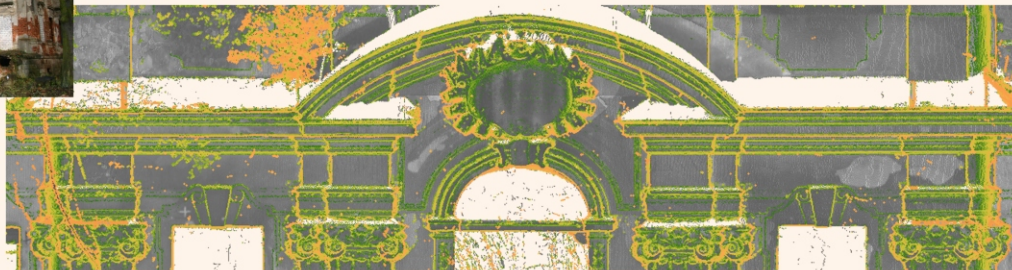
W trakcie prac terenowych wykonane zostały 164 skany