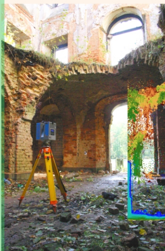
Skany zostały złożone z dokładnością <1\text{cm} , obliczenia wykonano programem ASCAN