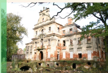
Pałac zniszczony w pożarze, jest w trakcie odbudowy.