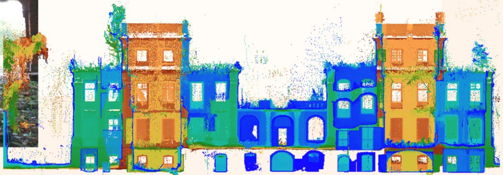
Das auswerten und Berechnungen von Punktwolken mit Hilfe ASCAN Software. Genauigkeitsanforderung < 10 mm.