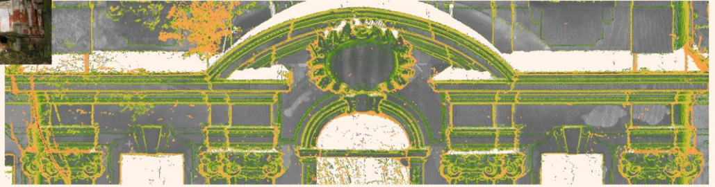
164 Mess- Positionen (Scannen) vor Ort bis zur Gesamtausmessung.