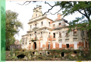
Das Schloss wurde durch Brand völlig zerstört. Das Objekt befindet sich zur Zeit im Wiederaufbau.