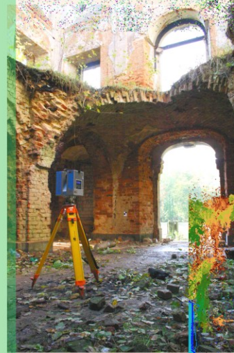
Genauigkeit <1cm, Berechnungen mit ASCAN