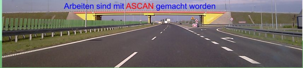
Arbeiten sind mit ASCAN gemacht worden